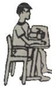
ท่าทางขณะนั่งเก้าอี้ ศีรษะและลำตัวตั้งขึ้นและก้มศีรษะเล็กน้อย ขณะกลืนเข่าอง 90 องศาและเท้าวางราบบนพื้น